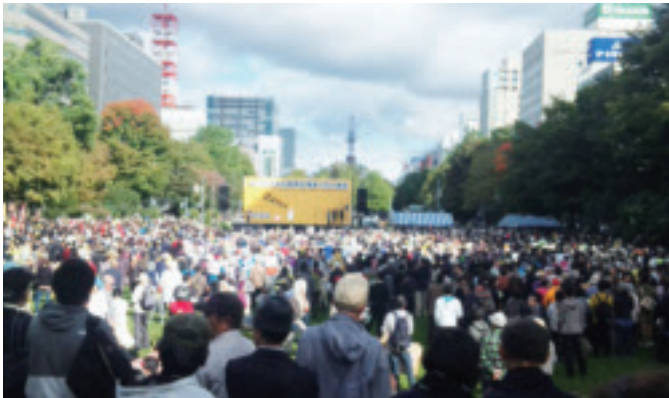
2012(平成24)年10月13日 札幌さようなら原発1万人集会

しかし、東電からはいまだに、申立人らの請求に対する具体的な認否（回答）が返ってきていません。半年以上にわたり放置されている状況です。東電の不誠実さは今に始まったことではありませんが、それにし