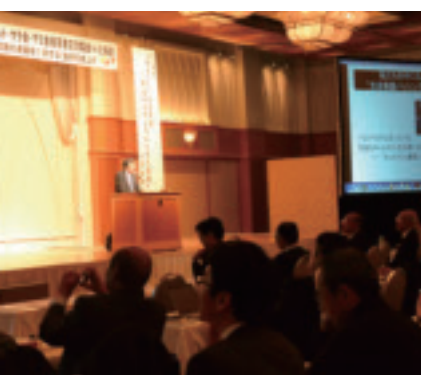
講演する水島教授