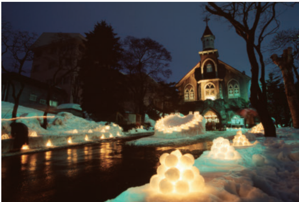
雪あかりの路：富岡教会（小樽市）